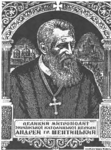
Митрополит Андрей Шептицький

Ідея створити художній фільм про Митрополита Андрея, як не дивно, виникла не у галичан, які знають цю величну постать, а у східняків: автора сценарію Миколи Шияна і режисера Олесь Янчука. Це не буде цілком біографічний фільм. Автори роблять основний акцент не стільки на тому, що робив Слуга Божий, як хочуть показати, що було в основі його душпастирства, ту велику любов Митрополита у Бога, усіх людей, незалежно від віросповідання і національності.