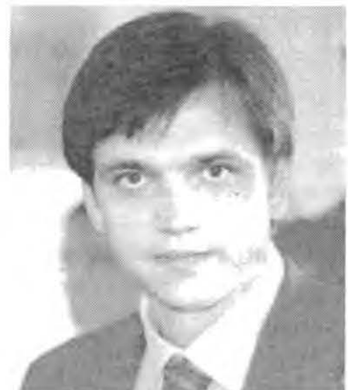
Міністер Юрій Павленко